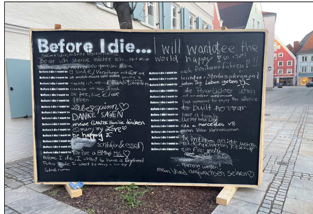
Die Wand kann an andere Interessenten/ Vereinigungen weiter verliehen werden.

Doch viele Passanten waren angetan von der Idee.“